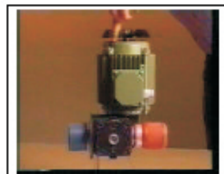
3. Girando manualmente la bomba situaremos el pistón en su punto más próximo al módulo.