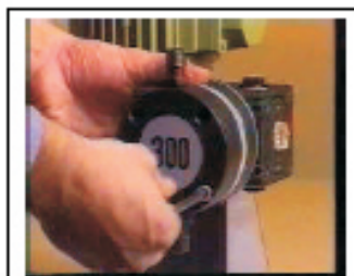
7. Montar el cilindro apretando los cuatro tornillos en cruz.