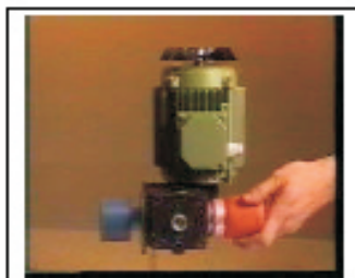
2. Situar el regulador al 100%