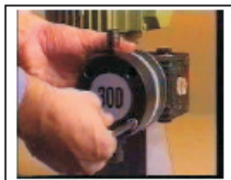
1. Desmontar el cilindro sacando los cuatro tornillos Allen