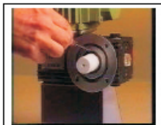
5. Con un objeto punzante limpiar los restos de los tornillos de la rosca del vástago