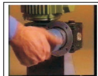
6. Mojar las roscas con fijatornillos (Loctite 222) y roscar el pistón